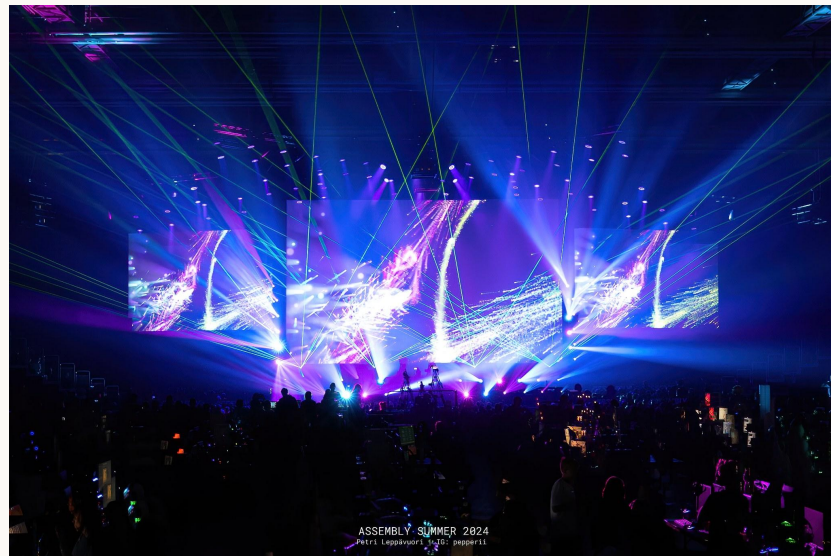
Assembly Summer 2024

Tapahtuman sisällöt ja kohderyhmät ovat muuttuneet vuosien varrella ja ajankohtaisia kysymyksiä on esimerkiksi kiinnostavuus nykynuorten, perheiden ja perinteisten kohderyhmien joukossa. Digitaalisen kulttuurin monimuotoistuminen ja uudet teknologiat luovat haasteita.